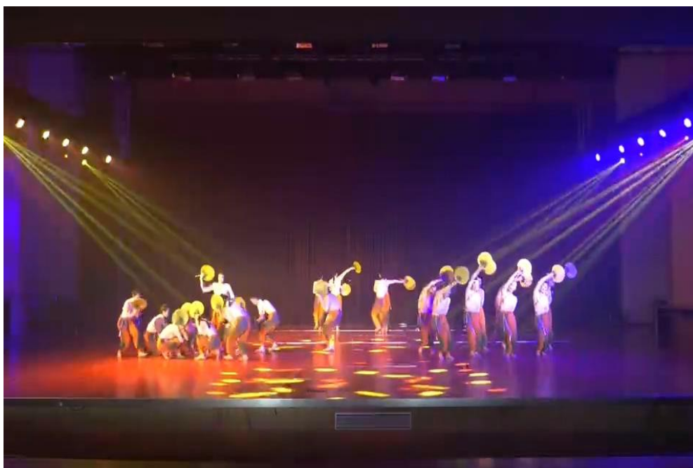
图 12 舞蹈作品《风吹稻花香两岸》荣获山东省中小学校园艺术节舞蹈专项活动二等奖

师生自发组织成立了“日照师范旭日志愿服务队”，并积极参与志愿服务活动，到敬老院看望孤寡老人，到社区为留守儿童、困难家庭孩子辅导作业等等。学校志愿服务队每年组织的志愿活动 10 多次，160 名党团员志愿者人均年参加志愿服务时间累计 30 小时以上。