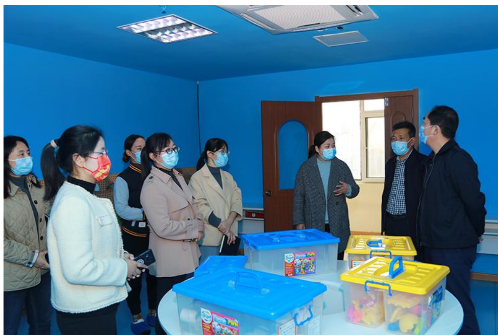
图 23 学校组织专业教师前往幼儿园进行调研

学校将教学生态转化为课程项目，形成了“五三二一”校本课程开发模式。构建了“五位一体跨界融合”的课程开发团队。成立“职业教师+幼儿园+非遗企业+美术馆+对口高校”专家工作队，多种形式送教入园。创建了“市、区县、乡镇”幼儿园三级联动课程合作开发模式。针对不同类型的幼儿园，研究制定不同的策略，开展项目化、模块化、主题化园本美术活动。实现了“校本、园本”课程双线互补。挖掘乡土资源，进行园本、校本项目设计，开发农村幼教美术特色课程。构建了师、生、幼一体成长学习平台。在研究过程中，诞生出一大批优秀毕业生扎根农村幼教，继续指导农村幼儿，提高幼儿表现美、鉴赏美、创造美的能力，提升了市域经济服务水平。