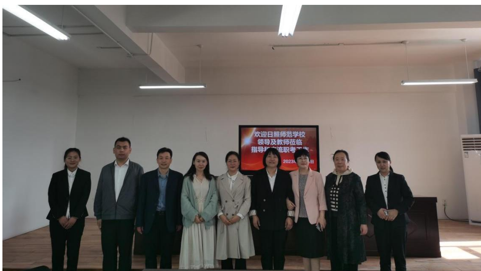
图 15 赴日照市农业学校开展学习交流活动

按照国家政策深入把握、有效推进职教高考工作。组织教师参加省职教高考研讨会，赴齐河职业中专、日照市农业学校等省优秀院校开展学习交流活动。组织教师充实校内职教高考试题库。与工业学校、农业学校等市内相关学校成立语数英职教高考公共学科联盟，以“资源共享、优势互补、齐心协力、合作共赢”为宗旨，明确了资源共建共享、组织协调交流研究活动、推进学科、课程建设。