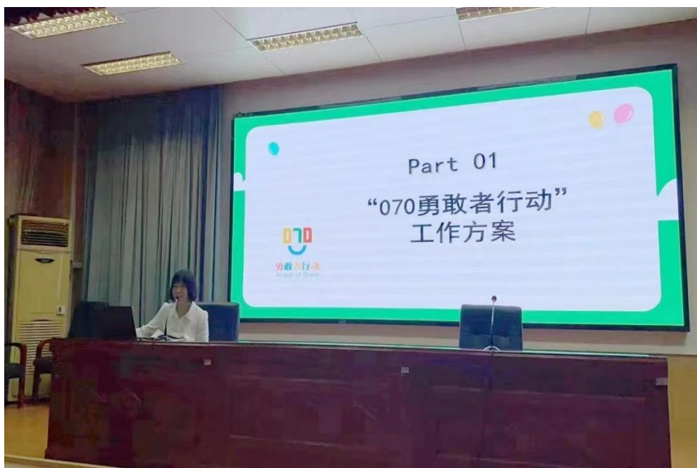
图8 日照师范学校“070 勇敢者行动”工作方案培训会议

修订《日照师范学校加强校园欺凌防治工作实施方案及应急预案》，挂牌成立“070 勇敢者行动”工作室，开展“070 勇敢者行动”相关活动，让学生认识到校园欺凌的严重危害，不做欺凌者、旁观者，避免成为受害者。在“线上线下家访”“家长课堂”“家长进校园”等活动中，加入“防治校园欺凌家校沟通”环节，把做好做实家庭教育作为防范校园欺凌事件的重要途径。并通过家长反馈意见、实地走访摸排校外社会闲杂人群、校内外信息整合收集校园欺凌问题，并对外公布校园欺凌举报信箱和电话，对发现问题及时进行记录和处理。各项举措并施，为促进学生身心健康发展，保障校园安全、维护校园稳定、推进平安校园、和谐校园建设提供良好的育人环境。