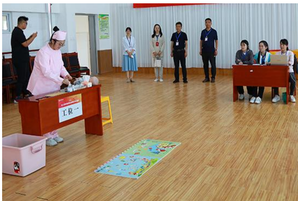
图 25 学校 1+X 婴幼儿保育实训室

作为教育部 1+X 幼儿照护职业技能等级证书的试点院校，学校按教学和考核标准建设了 1+X 婴幼儿保育实训室。2022 年学校幼儿保育专业成功立项市高水平专业和省特色化专业，以此为契机，计划打造高水平实训室。