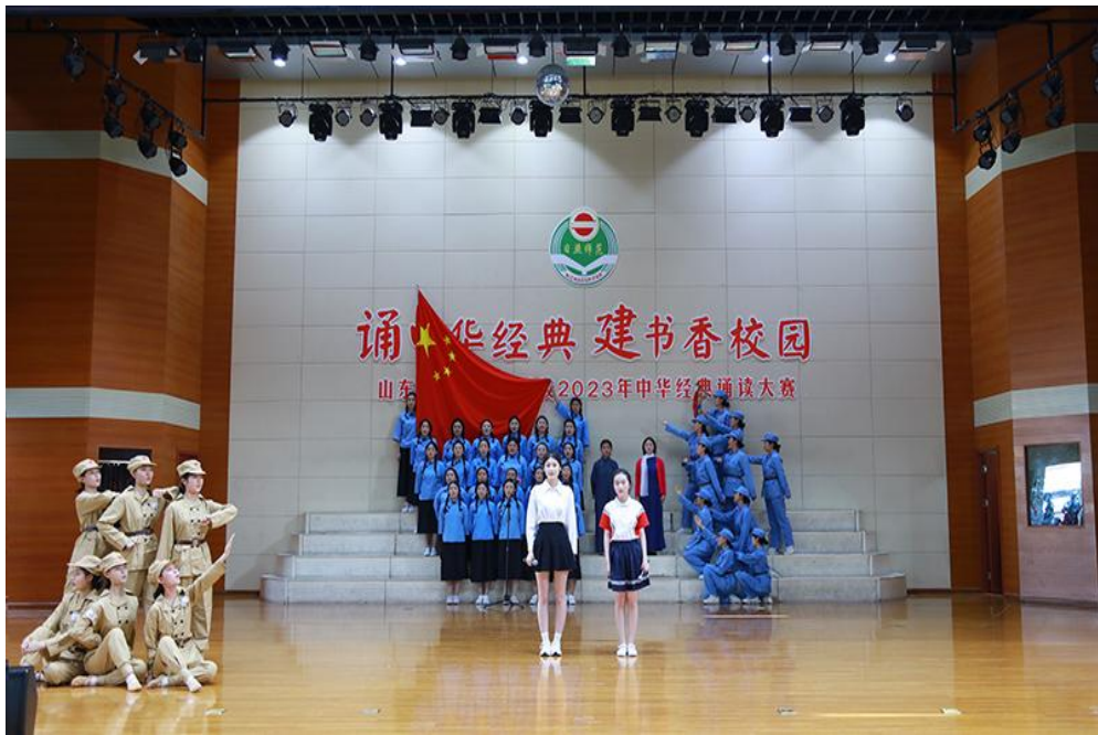
图 31 “诵中华经典，建书香校园”经典诵读大赛

坚持“优秀传统文化进课堂，”利用语文，政治等课程资源，把中华民族特有的思维方式，价值取向，审美情趣，行为模式，德行素养和社会民俗贯穿到课堂，使学生接受民族文化的熏陶，吸收民族精神的营养，力求将现代意识和传统文化融会贯通，培养即具有现代精神，又富有中华优秀传统文化的“现代人”。积极探索开发相关的校本课程，将民歌，故事，戏曲，表演，绘画等纳入课程内容，把坚持教育教学与弘扬中华优秀传统文化结合起来。