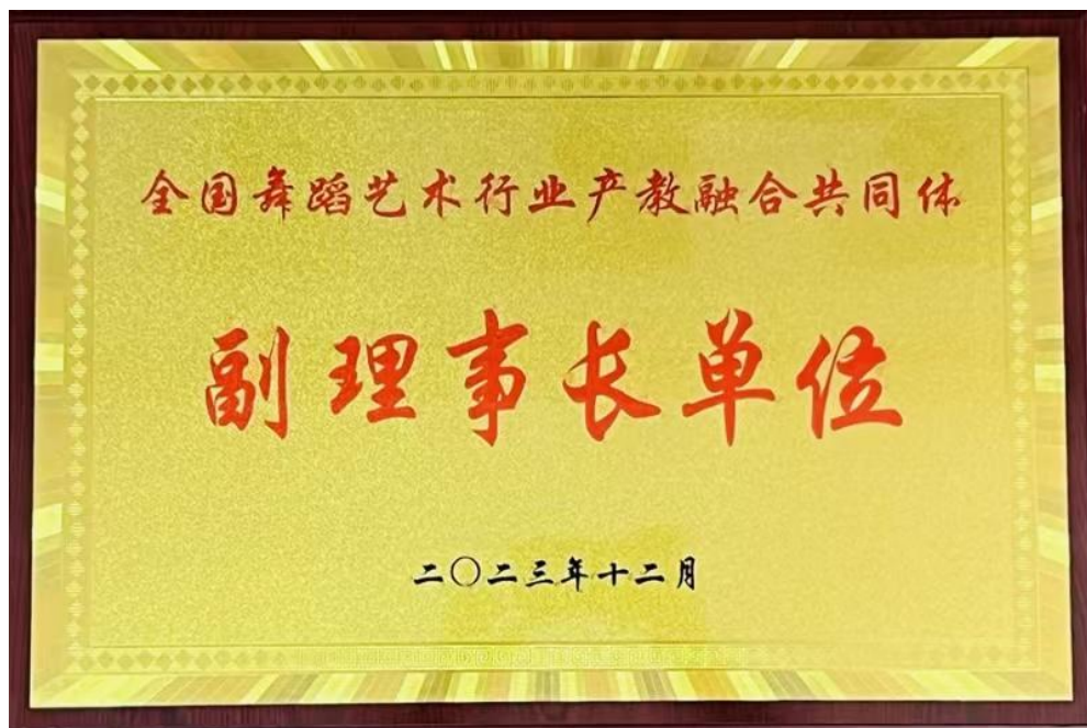
图 22 学校当选全国舞蹈艺术行业产教融合共同体副理事长单位