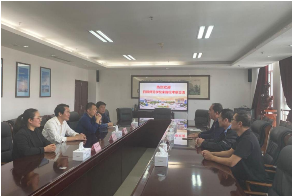
图 13 学校领导赴山东理工职业学院洽谈五年制高等职业教育专业点设置工作

学校领导先后赴山东理工职业学院签订绘画、旅游管理、智慧康养等专业的合作办学协议；赴山东水利学院签订计算机平面设计专业的合作办学协议；赴日照职业技术学院签订学前教育专业的合作办学协议，推动学校与高职院校联合举办初中后五年制高等职业教育获得新突破。