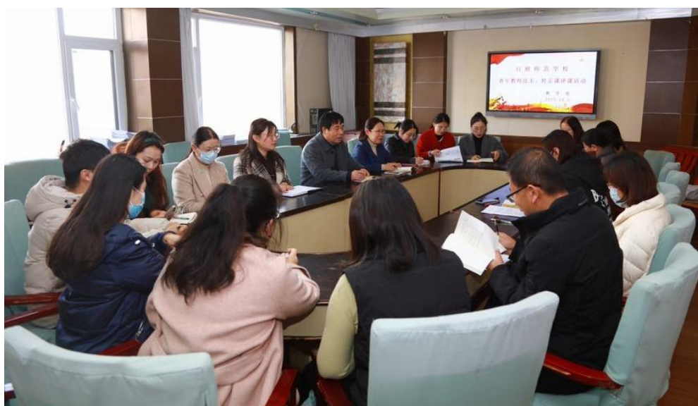
图 16 开展新教师听评课教研交流活动

规范教学常规，对教学计划、教案、听评课、作业批改、期中期末教学质量检查加大监督力度，并纳入绩效考核过程。举办“共赏一堂课”活动，要求每位老师每学年至少展示一次公开课，增强教师讲课、听课的实效性；同时开展推门听课、过关课、转正课、青年教师示范课、骨干教师开放周等活动总计 30 余次。