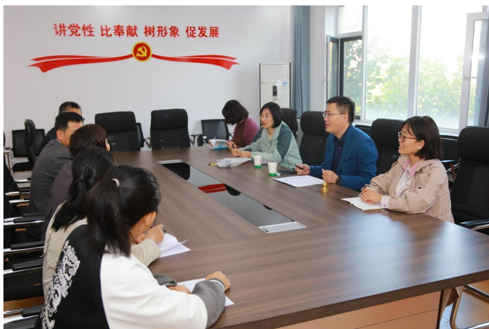
图 24 学校与山东省东影文化传播有限公司洽谈校企合作事项

在注重完善校内实训条件的同时，也不断深化校外实训基地建设。近年来，学校由党委书记、校长带队，组织副校长及相关科室负责人先后赴日照市北大金秋国际幼儿园考察调研，洽谈幼儿保育专业校企合作工作事宜。赴日照市阿拉丁幼儿园参加开园典礼，并进行幼儿保育专业校企合作实训基地授牌仪式。赴华越幼儿园艺术教育实践基地进行授牌仪式。幼儿保育专业、智慧健康养老服务专业与阳光大姐家政服务公司签订校企合作协议。音乐表演专业与音悦之声培训学校签订合作协议。学校的平面设计专业分别与山东省东影文化传播有限公司、日照陋室和金海美术装饰有限公司签订了合作办学协议，共建校外学生实训基地。绘画专业分别与日照扬帆广告装饰有限公司和日照大朴草堂文化传媒有限公司签订协议共建校外实训基地。