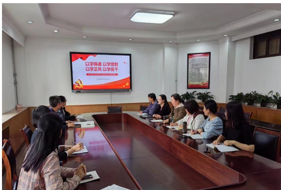
图2 班子成员讲党课