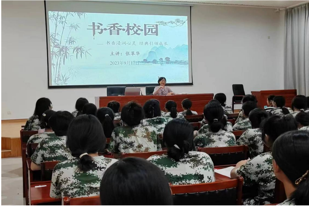
图 33 国学经典专题讲座