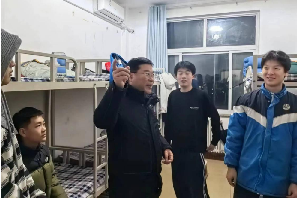
图 4 班子成员深入师生倾听意见建议

展相关调研，带着问题深入一线，深入师生，倾听意见建议，撰写专题研究报告 6 篇，完成正反面典型案例调研报告，为师生解决实际问题 6 个，提高了师生对学校工作的满意度。