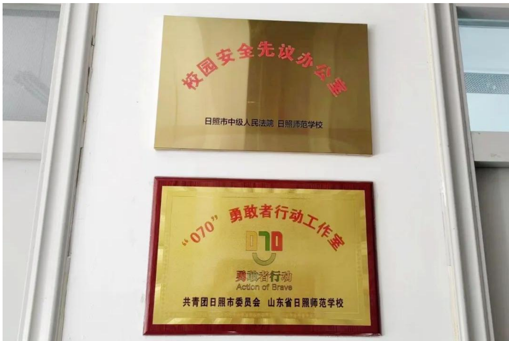
图9 成立日照师范学校“070”勇敢者行动工作室