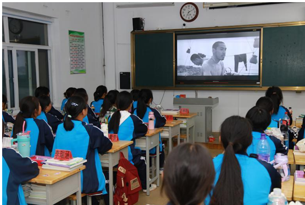
图 30 日照师范学校“电影之夜”活动

为提升校园文化的内涵和深度，帮助学生在思想精神层面实现健康成长，学校紧抓“红色文化”基调，切实开展特色校园文化建设。充分利用楼梯、走廊、教室等进行系统性的布局，形成红色革命、国防知识、艺术瑰宝、国学经典、科普长廊等多个“楼层有主题、墙面会说话”主题文化区，让红色文化渗透到学校的每一个角落，使学生在潜移默化中热爱党、热爱祖国。学校聚焦“立体式课程建设”，设计建造了德育教育阵地，以图文结合的形式，展示了中国共产党的光辉历程，中华民族的民族精神、中国特色社会主义文化等内容。校党委充分利用学校网站、“学习强国”、微信公众号、微博、抖音等线上平台，对开展的“红色校园文化”活动进行宣传，