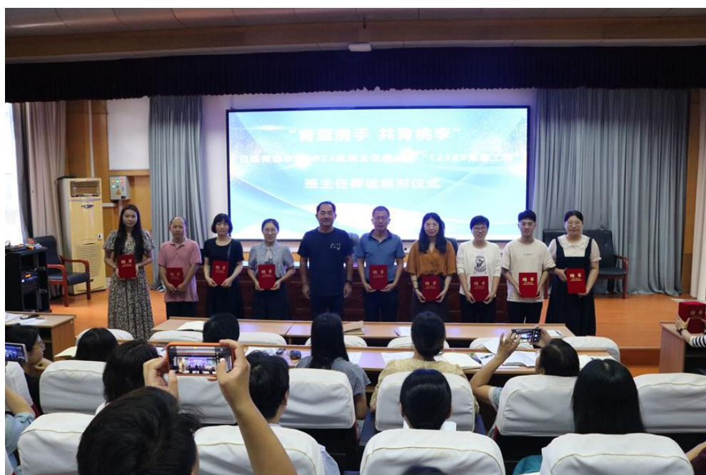
图 18 “12369 班主任青蓝工程”