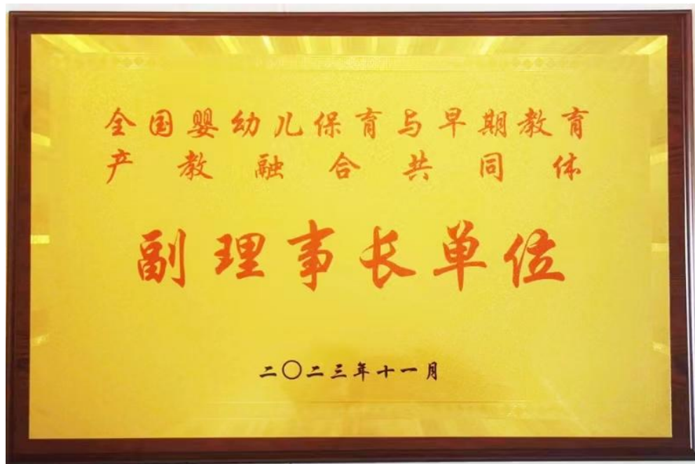
图 21 学校当选全国婴幼儿保育与早期教育产教融合共同体副理事长单位