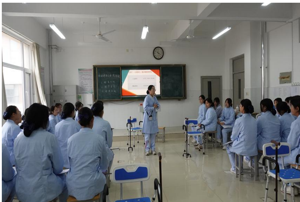
图 19 新教师过关课

学校及时对新教师开展培训，过关课、转正课、青年教师示范课三课并举，帮助新教师迅速适应工作岗位。新教师入职第一学期，组织进行过关课，检验新教师是否能够适应课堂教学；新教师入职第三学期，组织进行转正课，评价新教师业务水平是否达标；新教师入职满两年，组织进行青年教师示范课，加强教学水平的提升。新教师在准备三课的过程中，认真备课、积极磨课，向经验丰富的骨干教师取经，钻研教材，精心进行教学设计，教学能力得到迅速提高。课堂上，新教师们充分发挥学生的自主合作学习能力，课堂教学扎实高效，课堂积累内容丰富，课程设计精巧紧密，师生互动恰到好处，展示了属于他们的课堂风采。