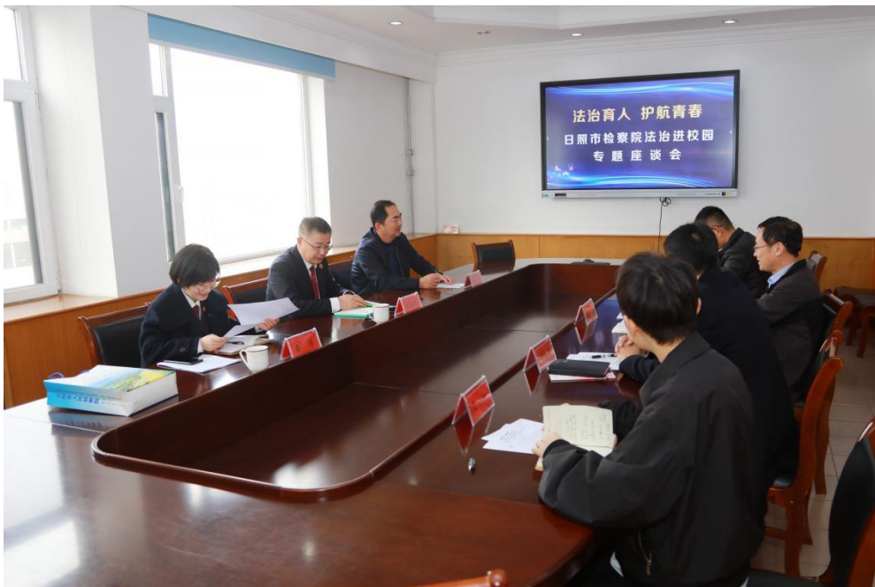
图7 法治副校长聘任仪式暨日照市检察院法治进校园活动