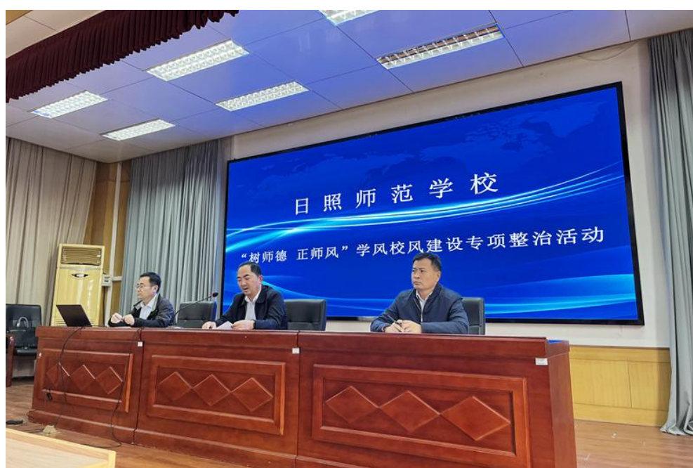
图 20 日照师范学校“树师德 正师风”校风教风学风建设专项整治活动专题会议

贡献、重业绩的评价和绩效激励机制，逐步完善学校《绩效考核与分配办法》等制度，体现多劳多得、优绩优酬，实现对全体教职工的绩效考核全覆盖，激发教师队伍潜能。以个人绩效评价为基础，构建教学单位的绩效评价体系，推动资源和权责在教学单位之间的合理配置，深化二级管理模式，撬动学校体制机制创新，持续激发办学活力，推动学校高质量内涵式发展。