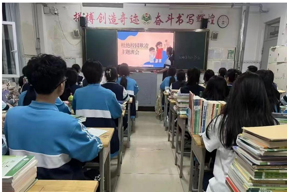
图10 开展杜绝校园欺凌主题班会