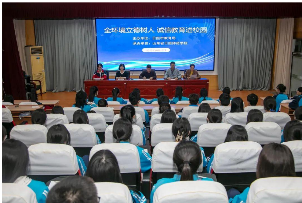
图5 诚信教育主题活动

精神。组织开展“学党史 颂党恩 跟党走”为主题的党的光辉照我心诵读活动和“永远跟党走，筑梦新时代”学生硬笔书法大赛，引导学生传承红色基因，在青少年心中厚植爱党爱国爱社会主义情怀。