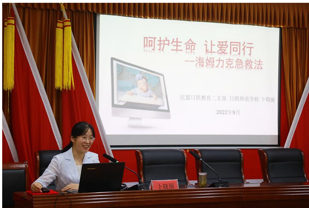
图 28 师生携手进社区，推广“海姆立克”急救法

文明出行、社区志愿服务、海岸绿道驿站志愿服务等活动，让党徽始终在志愿服务活动中闪耀。学校“红色志愿服务队”的党员同志们，充分发挥党员先锋模范作用，忠诚教育，服务社会，人均参与志愿服务活动 30 小时以上。