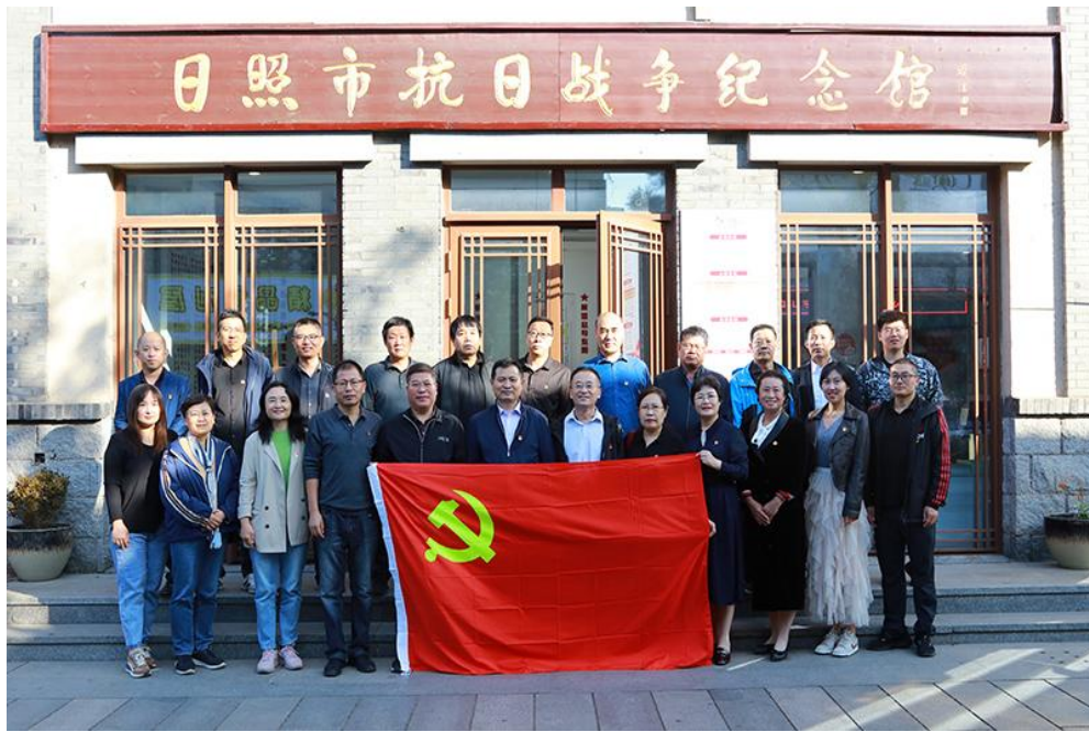
图 3 开展党性教育和廉政警示教育

组织党员干部到日照市抗日战争纪念馆、山东港口警示教育馆开展党性教育和廉政警示教育 2 次。动员全校党员干部运用线上平台学习交流，全校党员干部在“学习强国”的学习积分每天 40 分以上，在“灯塔 - 党建在线”的学习超过 32 学时，超额完成上级规定年度学时。