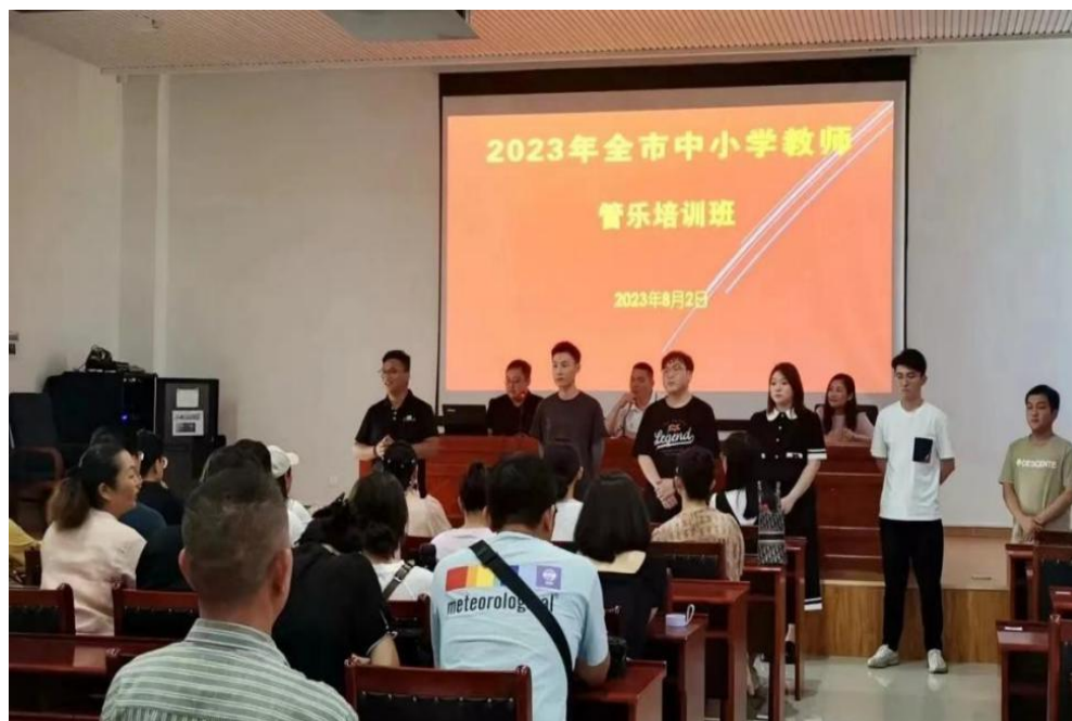
图 26 学校承担 2023 年暑期全市教干教师培训任务

人；12月测试全是中职在校生及乡镇机关人员 2000 余人。现场发放、邮寄普通话测试证书及历年测试的等级证书累计领取约 7300 人次。