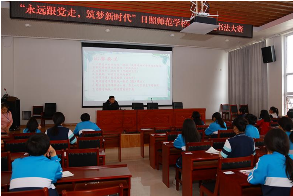
图6 “永远跟党走，筑梦新时代”学生硬笔书法大赛