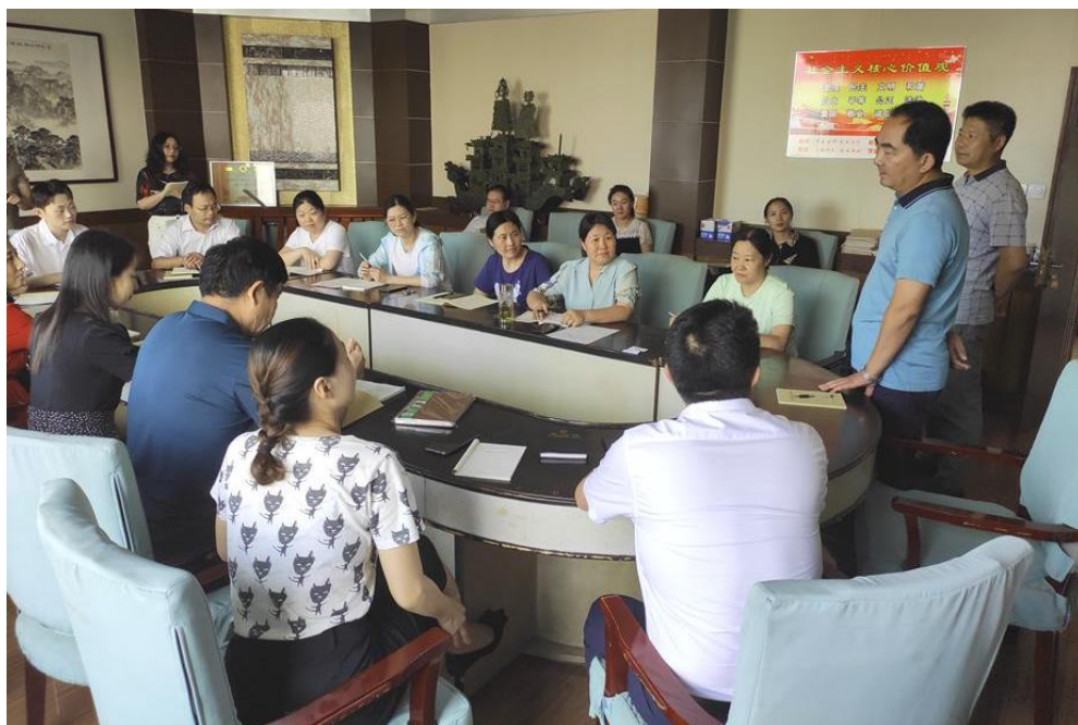
图 14 学校召开教材选用和建设专题会议

力支持，保证了教材工作的落实。学校重新修订了教材选用管理办法。要求各专业部应根据课程需要对教材进行择优选用，优先选用各级教育主管部门通过专家评审推荐的优秀教材，特别是“十四五”职业教育国家规划教材。鼓励教师参加教材编写和修订工作，现参编幼儿保育专业方面教材 2 部。