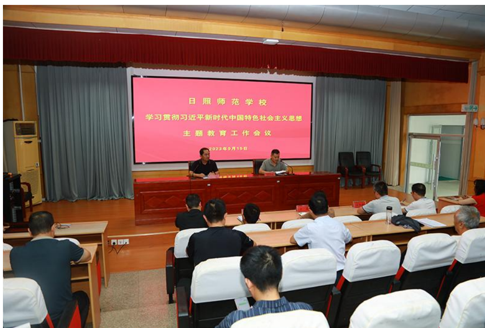
图1 日照师范学校学习贯彻习近平新时代中国特色社会主义思想主题教育工作会议

要领导带头为全校党员干部讲专题党课，6位班子成员分别在所在党支部讲党课，邀请“理响日照阳光宣讲团”成员来校作专题辅导。