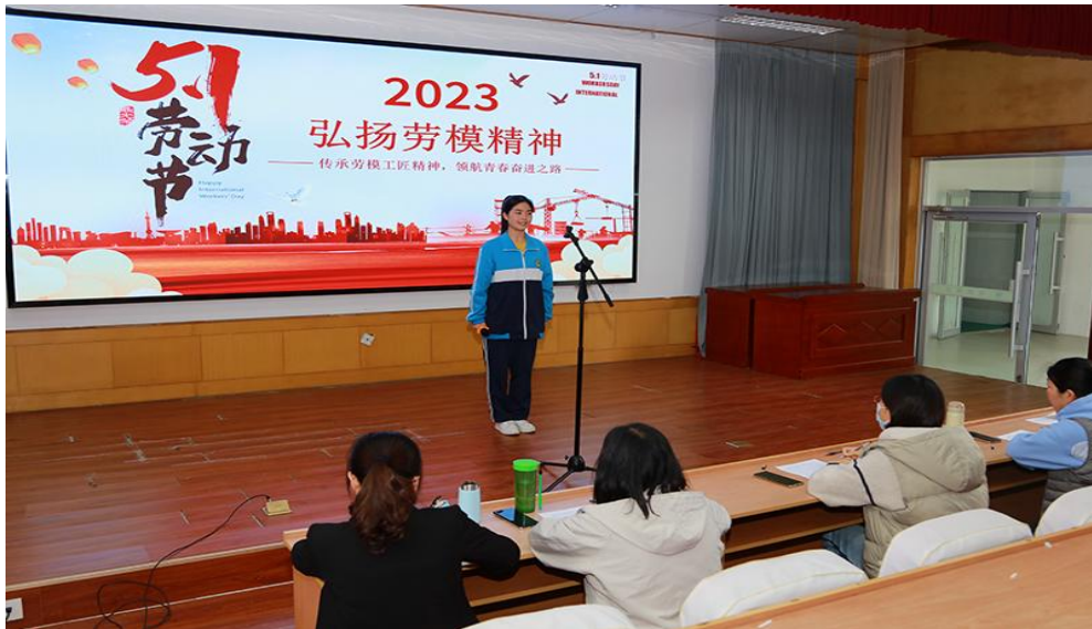
图 29 日照师范学校“传承劳模工匠精神·领航青春奋进之路”主题演讲比赛